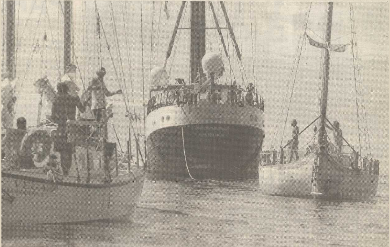
Greenpeace-skibet 'Rainbow Warrior' (i midten) får hjælp af bl.a. danske 'Bifrost' (th) tæt ved Mururoa-atollen. Inden for 24 timer ventes en mindre armada af skibe at forsøge franskmændenes første atomsprængning.

- Man føler sig lidt alene, når man ligger herude dag efter dag. Så er man sulten efter at få dansk radio ind via kortbølge. Men vi er glade for Ekstra Bladets engagement, siger den danske