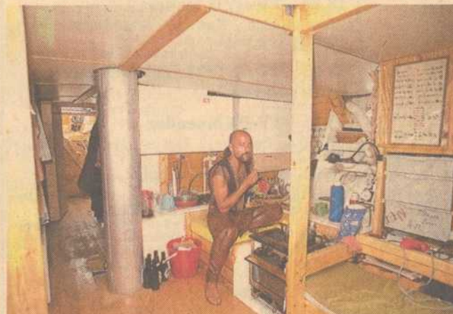
... og en stor sidde-spise-læsebriks samt bibliotek.

skinner, som skal give ham det økonomiske grundlag for jordomsejlingen.