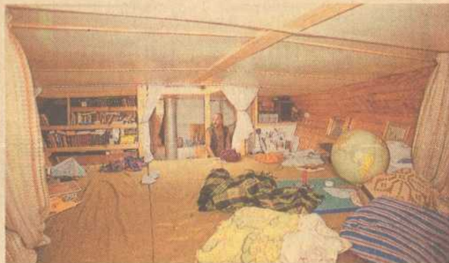
... én stor kæmpebriks med plads til otte-ti personer