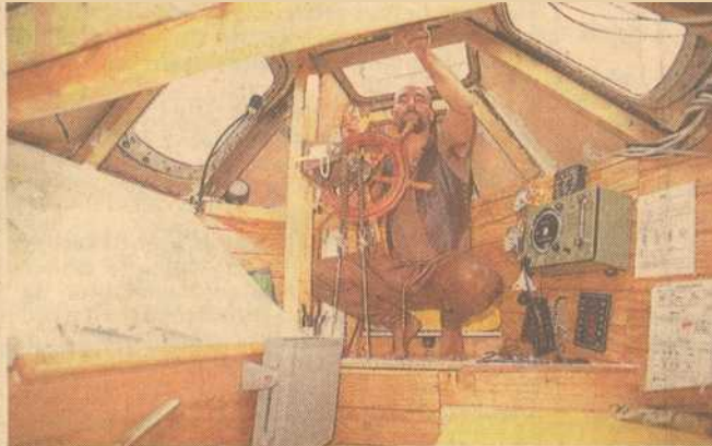
Blandt udstyret er satellit-navigatør og vejrkortplotter